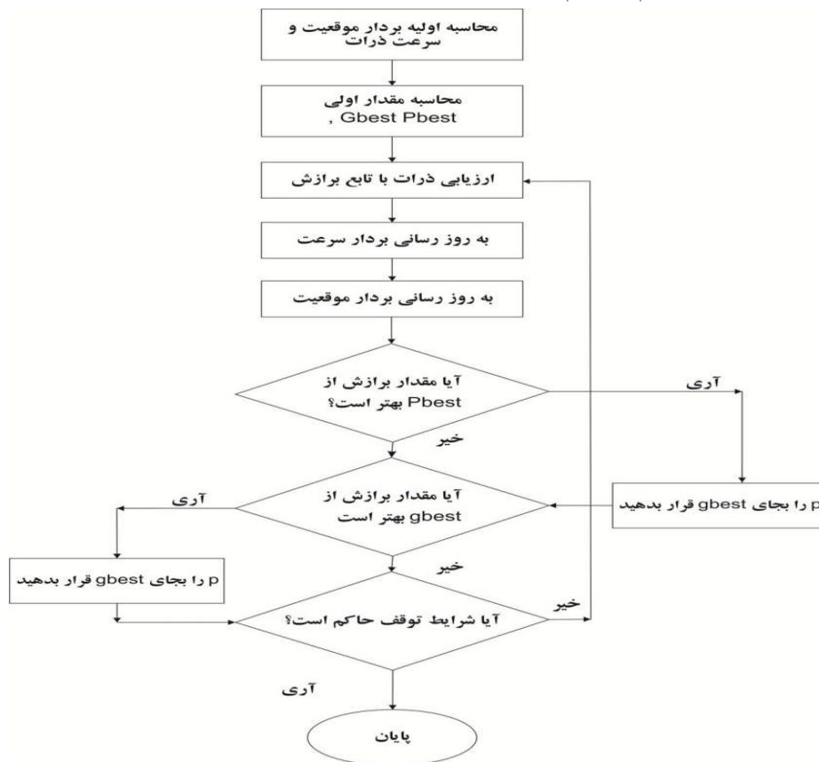
نمودار ب-۱: فلوجارت الگوریتم ازدحام

در زیر فلوجارت الگوریتم ازدحام ذرات نشان داده شده است: